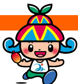
宮古島市イメージキャラクター 「みーや」